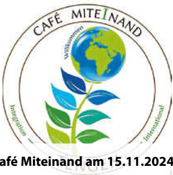
Café Miteinand am 15.11.2024

Die Jugendfeuerwehr Tengen wird während der Übung Glühwein sowie Punsch ausschenken.