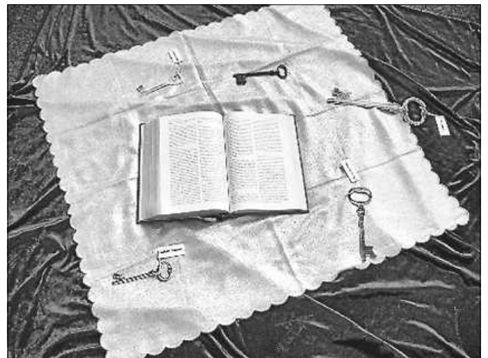
Stufen des Lebens