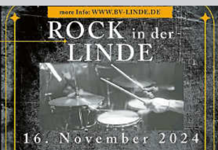
Rock in der Linde • SchlaPoJo