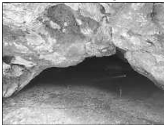
Eingang Wimsener Höhle