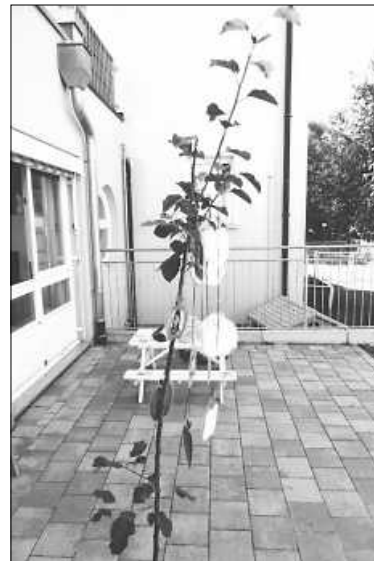
Das Team der Kita Büßlingen

Herausgeber: Stadtverwaltung Tengen, Marktstraße 1, 78250 Tengen. Druck und Verlag: NUSSBAUM MEDIEN Rottweil GmbH & Co. KG, Durschstr. 70, 78628 Rottweil, Tel. 0741 5340-0, Fax 07033 3204928. Verantwortlich für den amtlichen Teil, alle sonstigen Vereinbarungen und Mitteilungen: Bürgermeister Marian Schreier oder sein Vertreter im Amt. Verantwortlich für „Was sonst noch interessiert“ und den Anzeigenteil: Klaus Nussbaum, 78628 Rottweil. E-Mail: rottweil@nussbaum-medien.de Es gilt die jeweils aktuelle Anzeigen-Preisliste. Einzelversand nur gegen Bezahlung der ¼-jährlich zu entrichtenden Abonnementgebühr. Vertrieb (Abonnement und Zustellung): G.S. Vertriebs GmbH, Josef-Beyerle-Straße 2, 71263 Weil der Stadt, Tel. 07033 6924-0, E-Mail: info@gsvvertrieb.de, Internet: www.gsvvertrieb.de