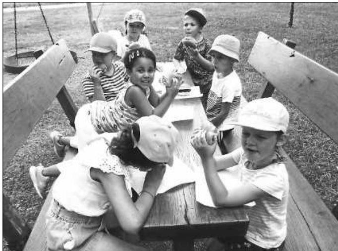
Die Vorschüler verspeisen die leckeren Würste

Das Kita-Jahr 2019/2020 war für die Kinder, Sie als Eltern und uns ein Jahr voller Einschränkungen, Änderungen, Spontaneität. Wir mussten uns alle auf die veränderte Situation einstellen und das Beste daraus machen, was oft kreative, spontane Reaktionen erforderte. Daraus ergab sich auch die Änderung der Abschlussfeier für die Vorschulkinder. In diesem Jahr wanderten die Kinder zur Hütte in Beuren. Wir alle bedanken uns bei Herr Speck, der uns die Hütte kostenlos zur Verfügung stellte. Beim Würstchengrillen, Spiel und Spaß verging dort die Zeit leider viel zu schnell. Die Geschichte vom „Ernst des Lebens“ schloss unseren schönen Grillausflug ab und die Kinder gingen erschöpft, aber glücklich nach Hause. Für die Kita haben die Vorschulkinder wunderschöne Traumfänger gestaltet, die in Zukunft unseren Gartenzaun schmücken werden und somit die Erinnerungen an die Kinder wachhalten wird.