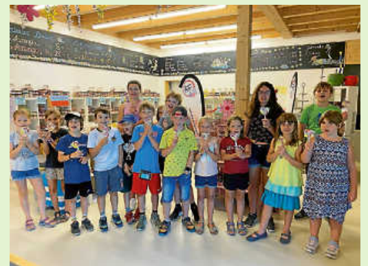
Besuch der Bonbon-Manufaktur 2023

Über Ihre Unterstützung würden wir uns sehr freuen.