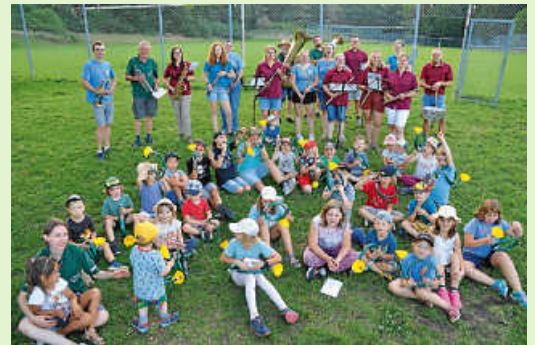
Musikalische Entdeckertour 2023