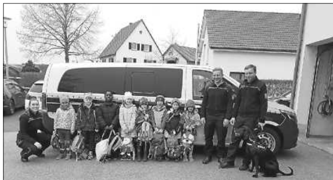
Besuch beim Zoll