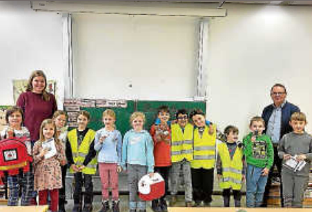
Sicherheit macht Schule