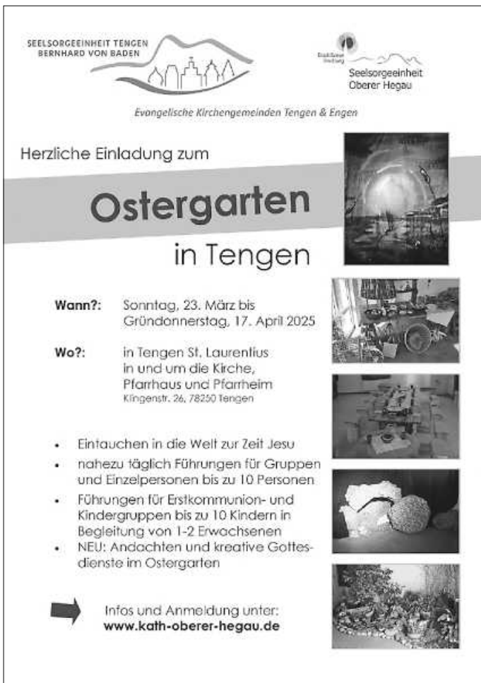
Plakat: SE OH