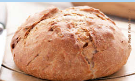
Öffentlicher Backtag am 13.07.2024