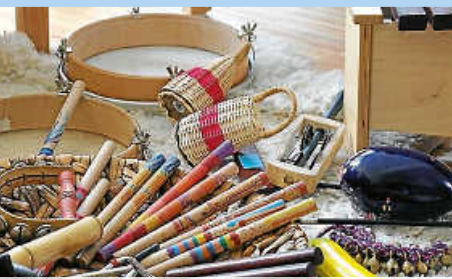
Schnupperstunde musikalische Früherziehung