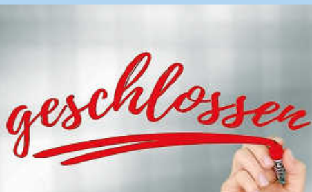
Rathaus & Einrichtungen am 19.07.2024 geschlossen