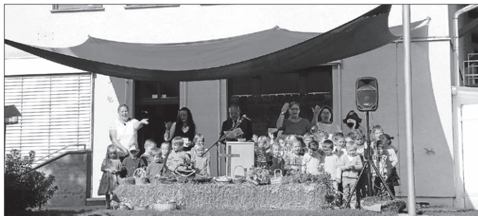
Das KiTa-Team Watterdingen

Ein großes Dankeschön allen Eltern, die uns beim Auf- und Abbau geholfen haben und dem Förderverein, der sich um die Getränke gekümmert hat.